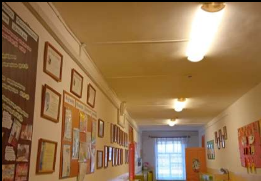
Верхняя левая точка