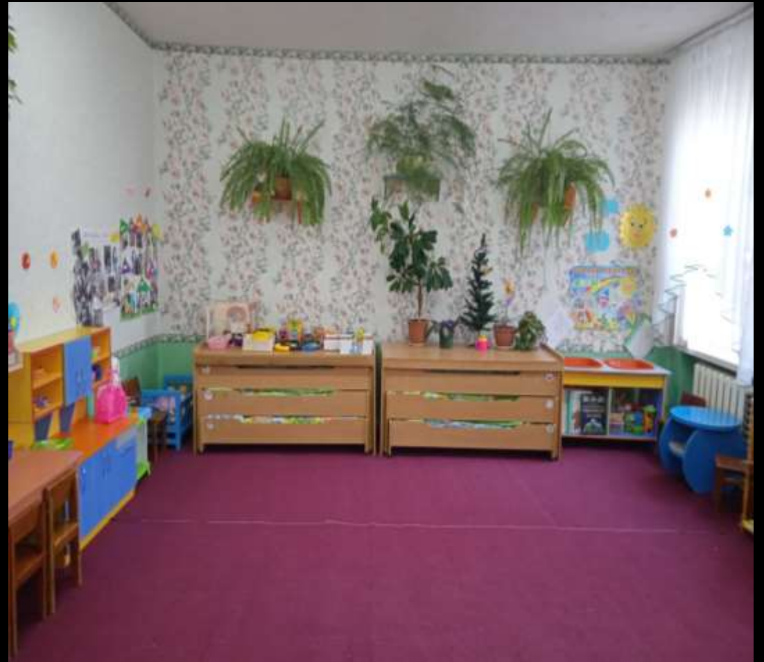
Вид из центра группы в противоположном входу направлении