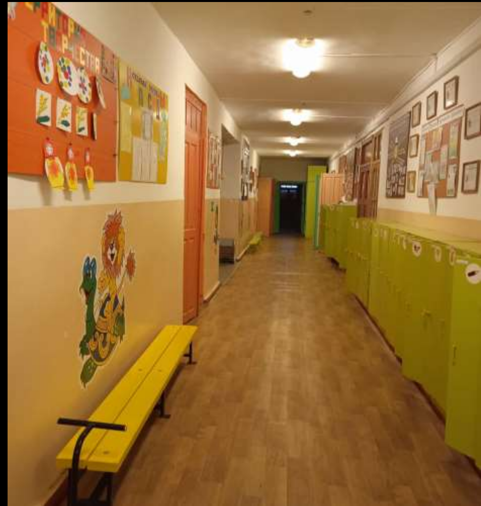
Вид из центра в противоположном входу направлении