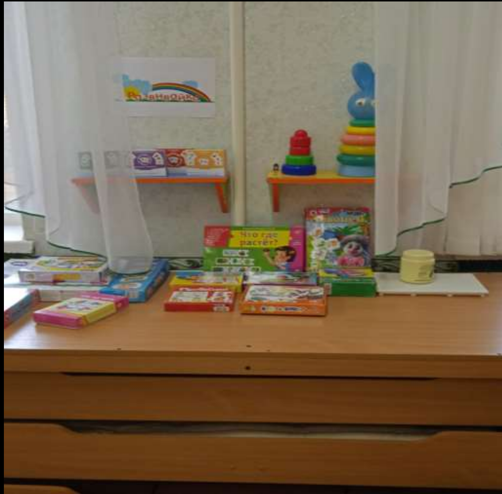
1.1.2. Рабочий сектор (уголок «Сенсорика - конструирование»)