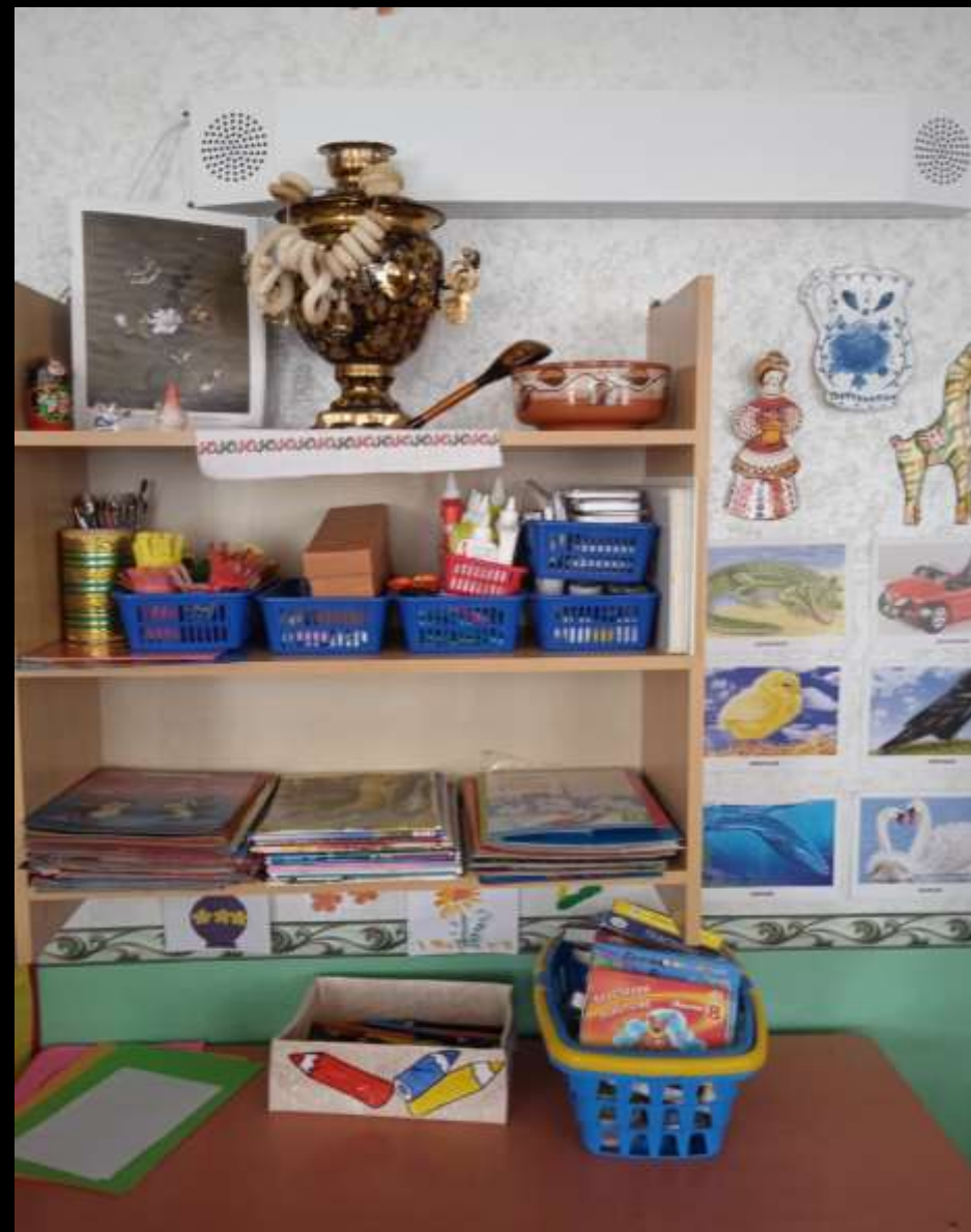
3.2. Спокойный сектор (уголок «Художественная мастерская»)