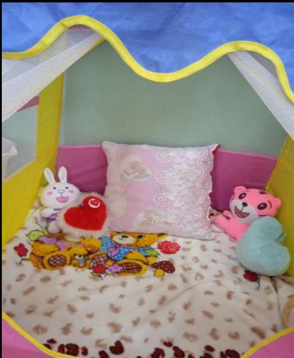
3.1. Спокойный сектор (уголок «Место для отдыха и уединения» )