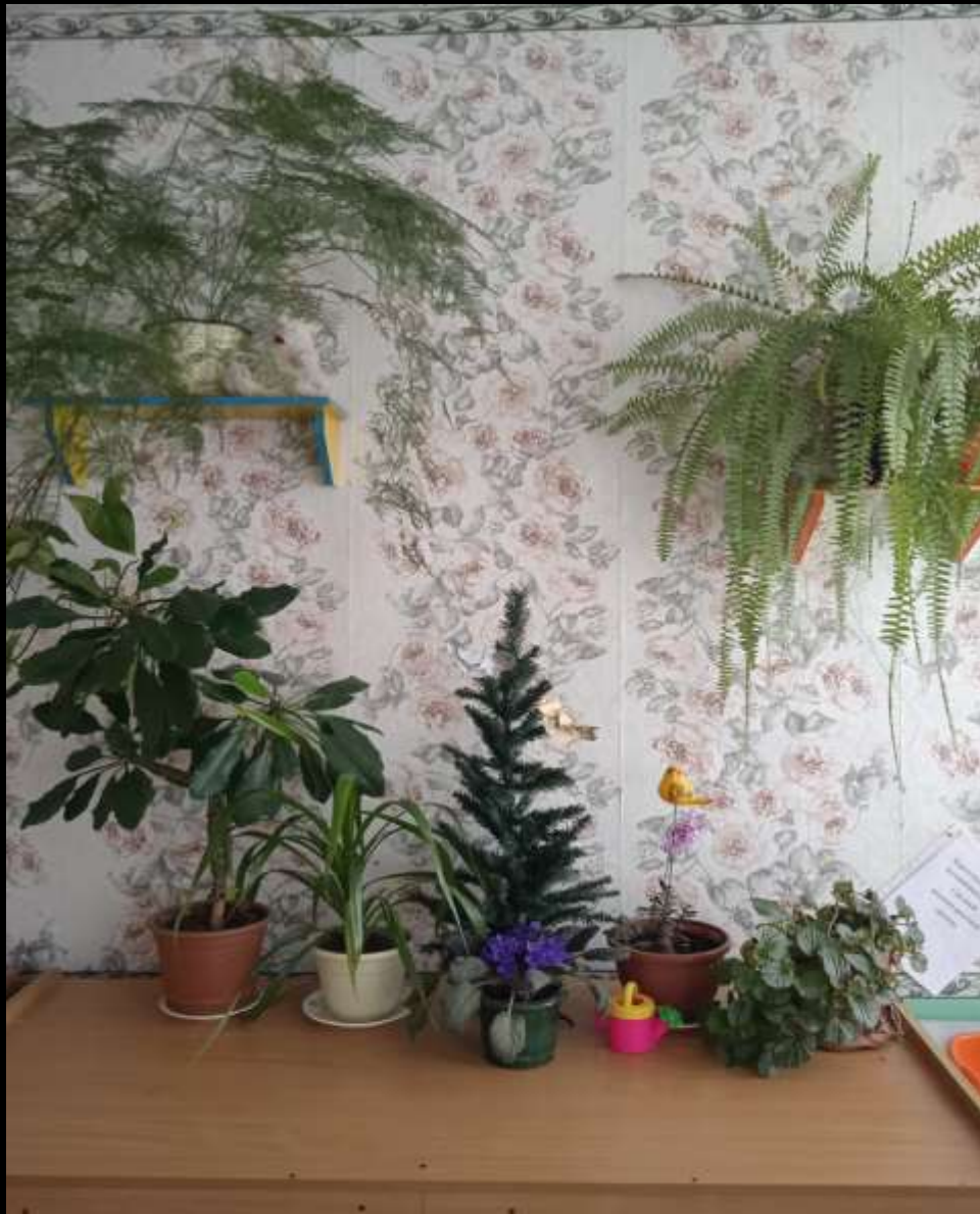
1.9. Рабочий сектор (центр живой и неживой природы)