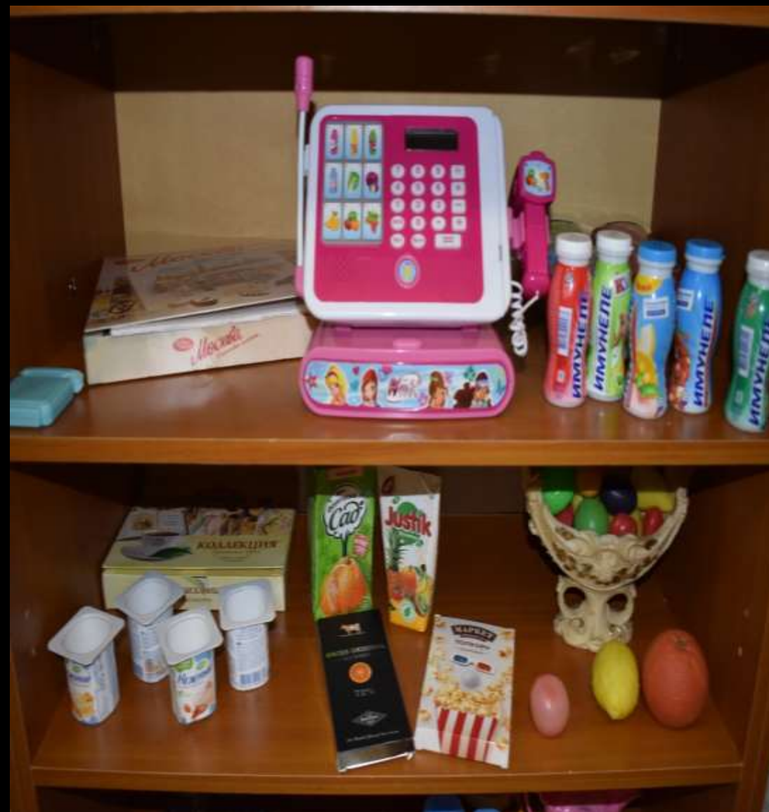
2.2.6 Активный сектор (уголок сюжетно-ролевые игры «Семья», «Магазин» )