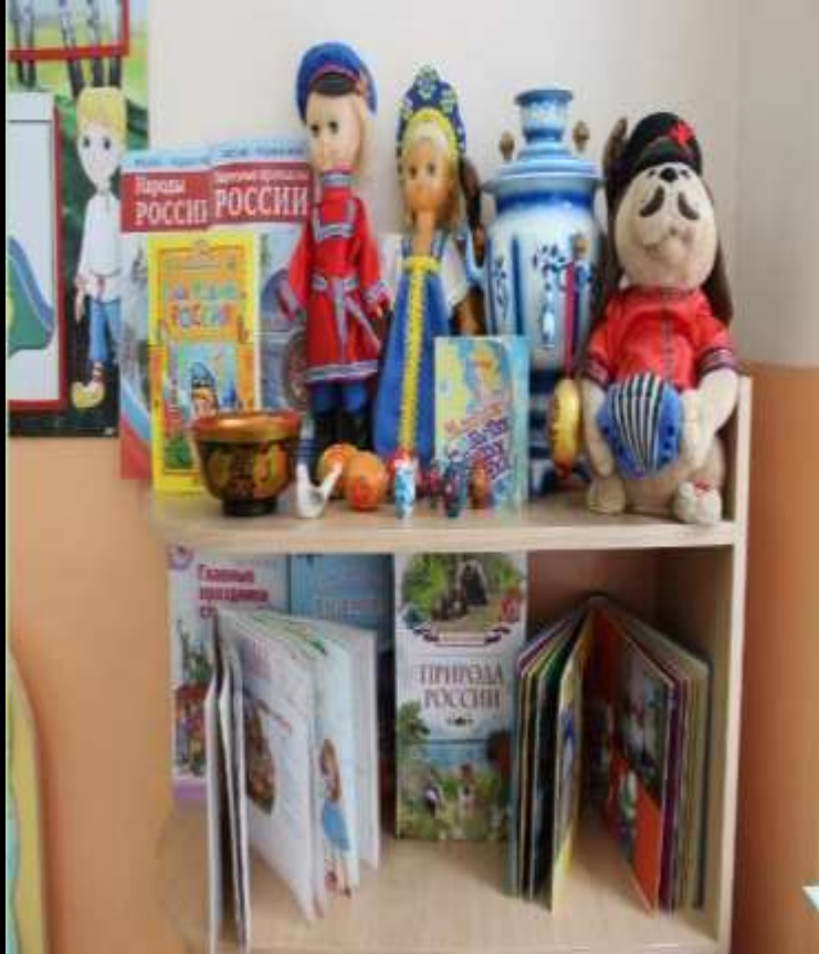
1.6. Рабочий сектор (уголок «Наследие культуры и социокультурные ценности»)