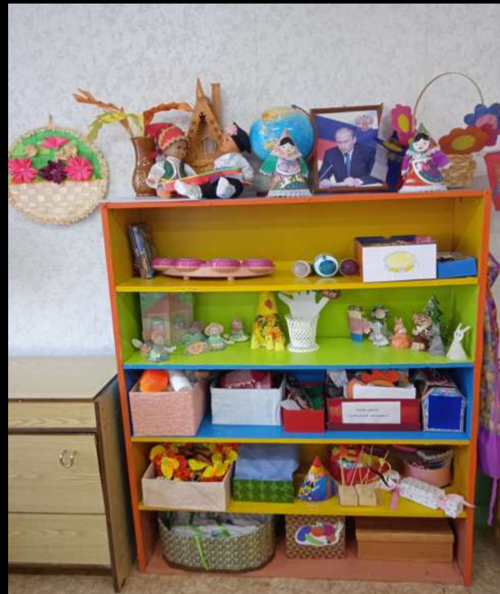
2.2.3. Активный сектор (уголок музыки)