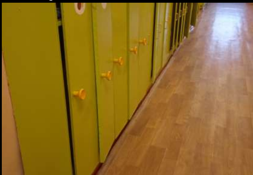
Вход в помещение, нижняя левая точка