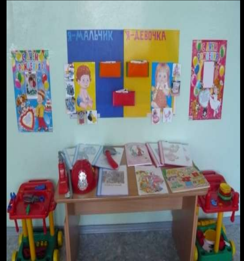
1.8. Рабочий сектор («Гендерное воспитание») Доступны разнообразные игрушки как для девочек, так и для мальчиков.