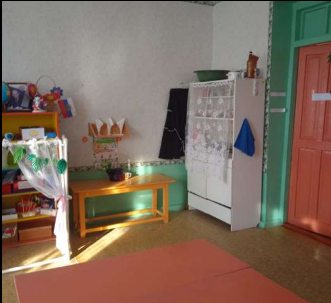
Вид из центра группы на вход в помещение