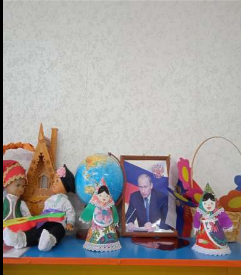
1.7 «Патриотическое воспитание» В модуле присутствуют куклы в национальных костюмах, имеется материал по декоративно-прикладному искусству России. Материалы центра пополняются работами детей: рисунки, тематическими альбомами «Моя семья», «Моя родословная», созданными совместно с родителями, фотографиями детей в альбом