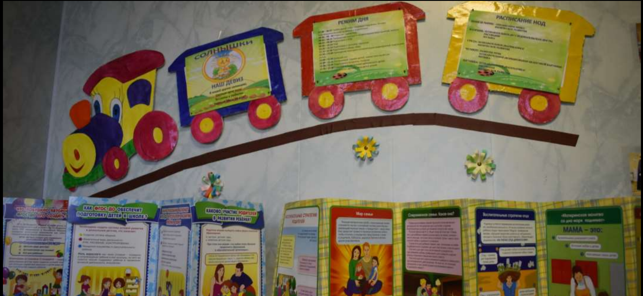
4.1. Среда для диалога с родителями (информационный центр)