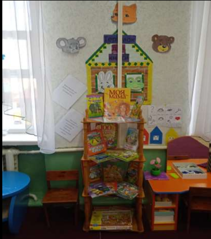
1.4 Рабочий сектор (уголок книги и развитие речи)