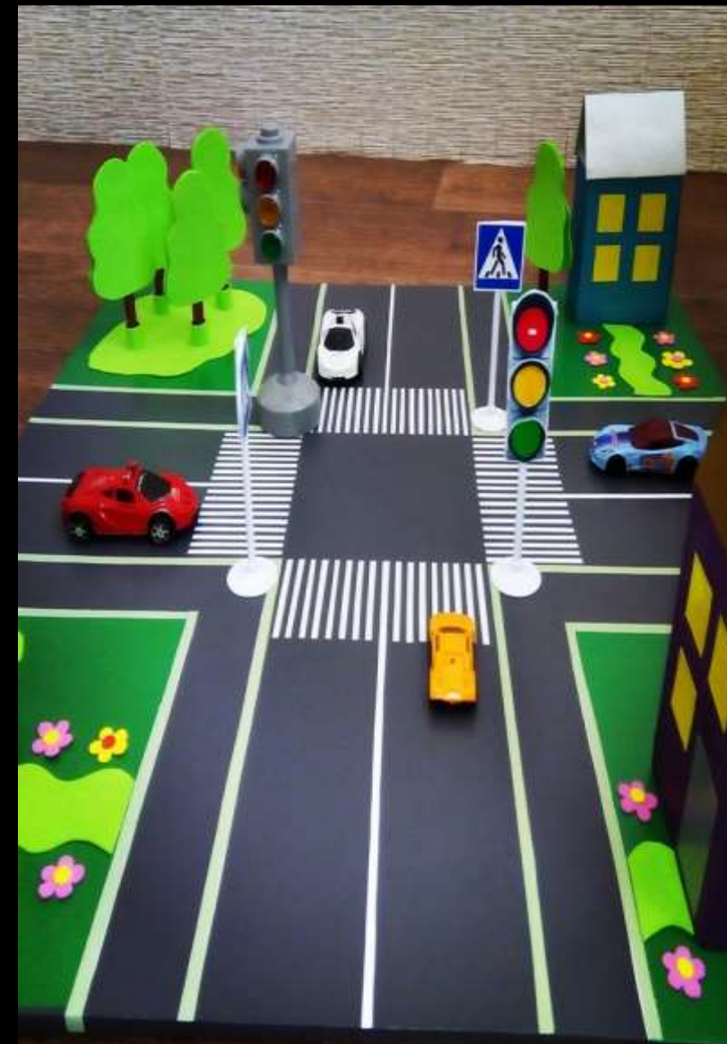
2.2.5. Активный сектор (уголок сюжетно-ролевые игры «Дочки-матери», «Семья», «Салон красоты», «Автопарковка» )