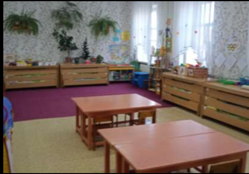
Верхняя правая точка