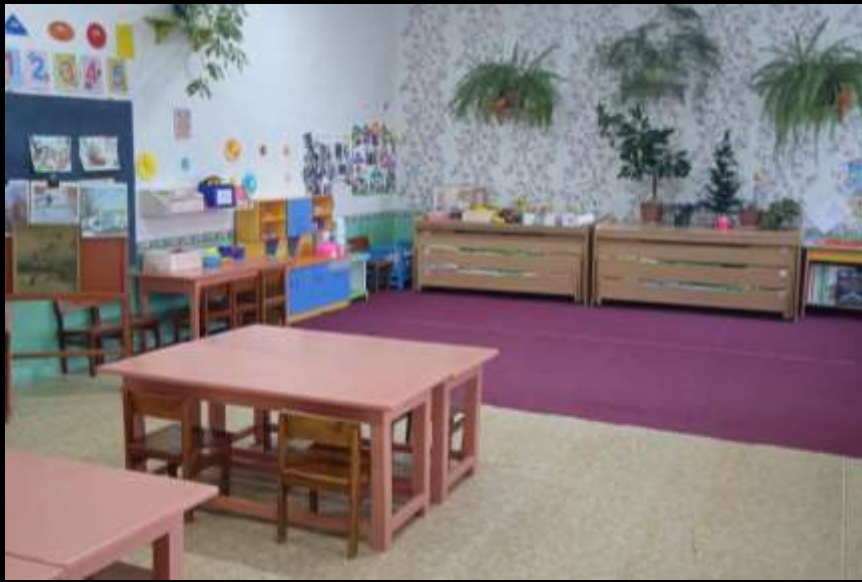
Верхняя левая точка