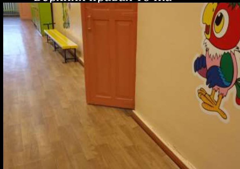
Нижняя правая точка

Помещение для приема воспитанников Образовательная тема «Весна.Мамин день»