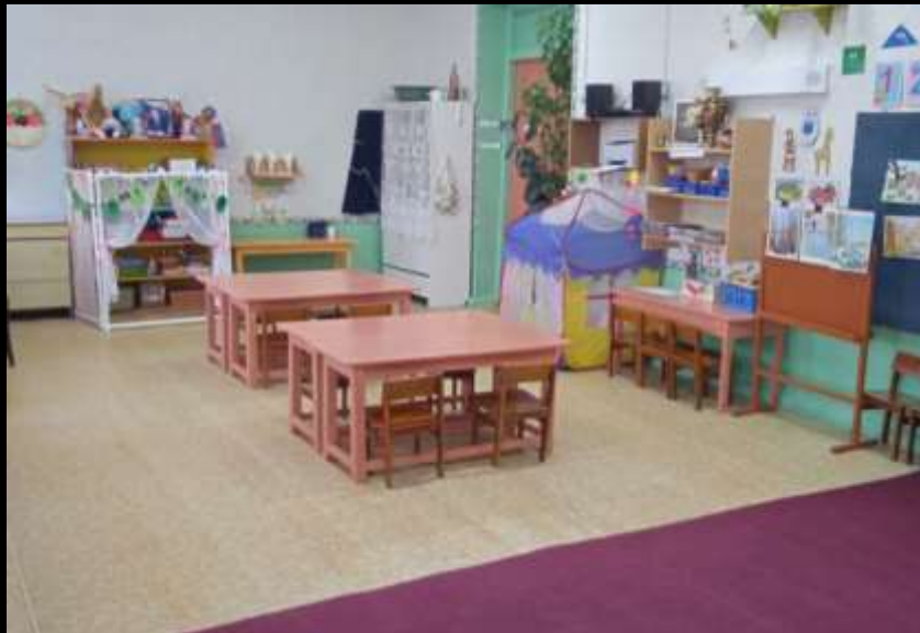
Вход в группу, нижняя левая точка