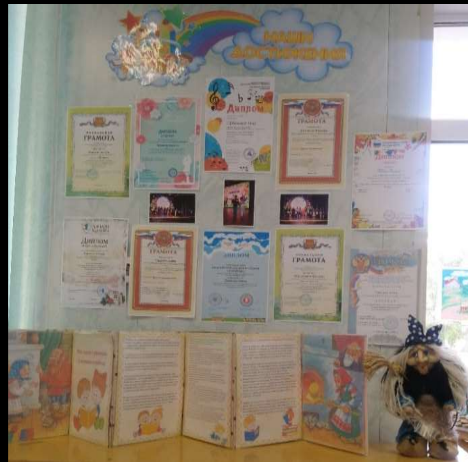
4.3. Среда для диалога с родителями (практический центр )