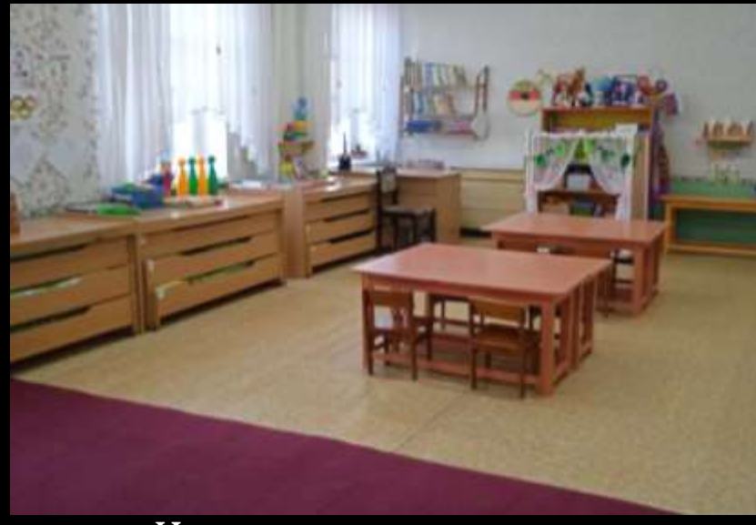
Нижняя правая точка