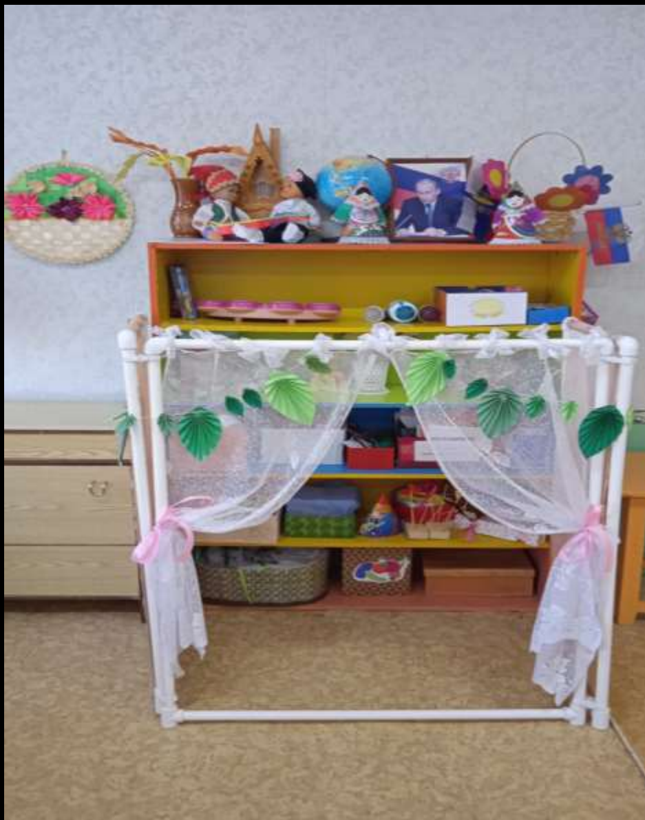
2.2.2. Активный сектор (уголок театра)