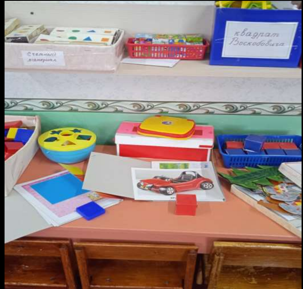
1.1.3. Рабочий сектор (уголок «Математика»)