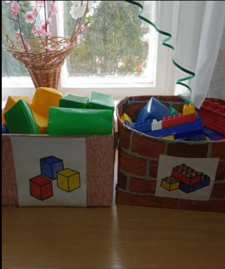
1.3. Рабочий сектор («Лего-конструирование»)