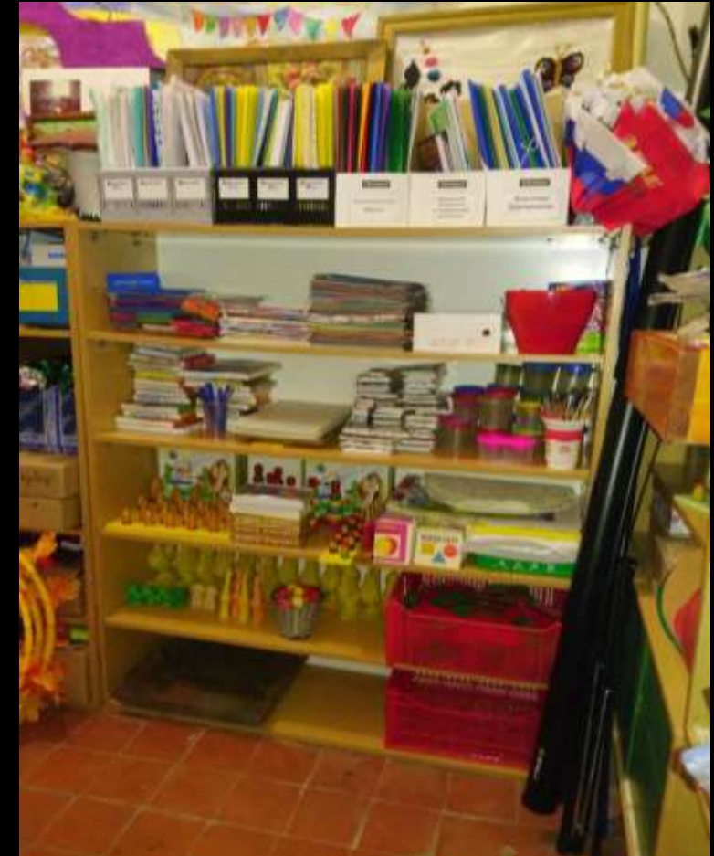
1.5. Рабочий сектор (организация хранения раздаточного и демонстрационного материала для познавательного и речевого развития)