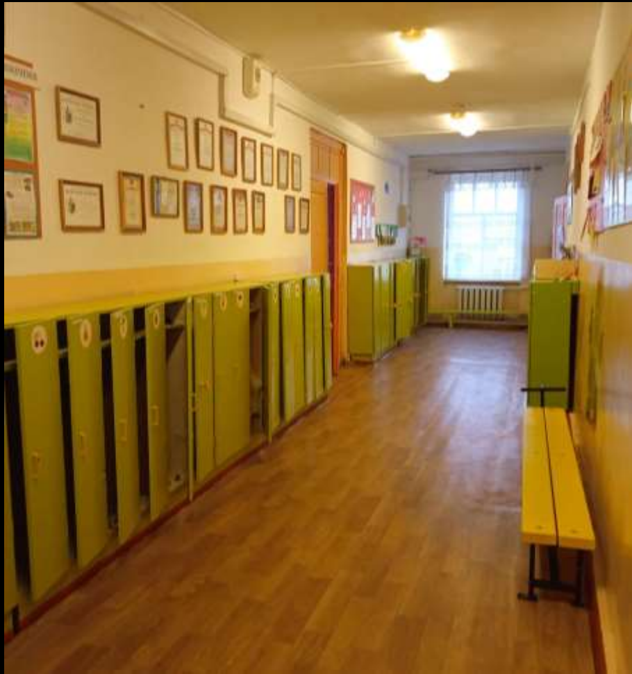
Вид из центра на вход в помещение