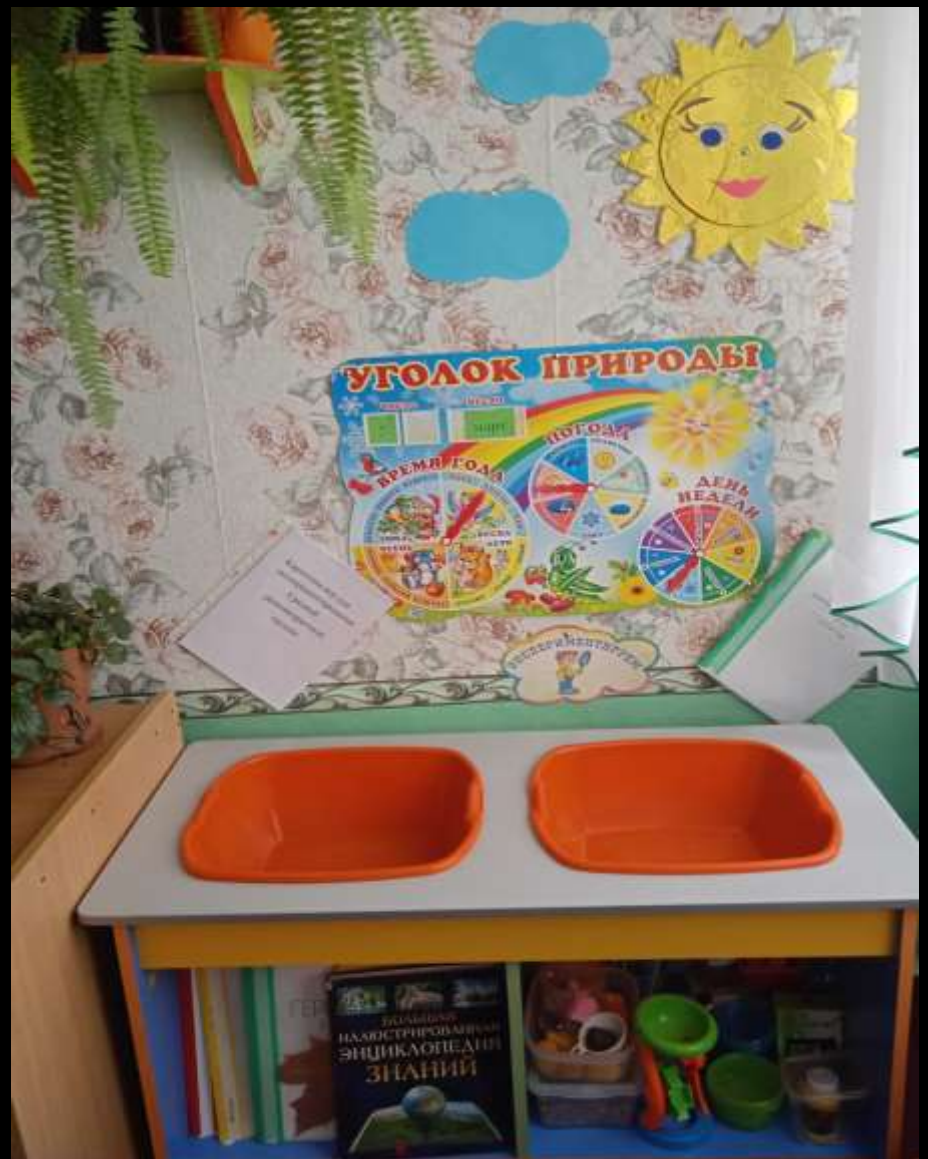
1.10. Рабочий сектор (уголок экспериментально - исследовательской деятельности)