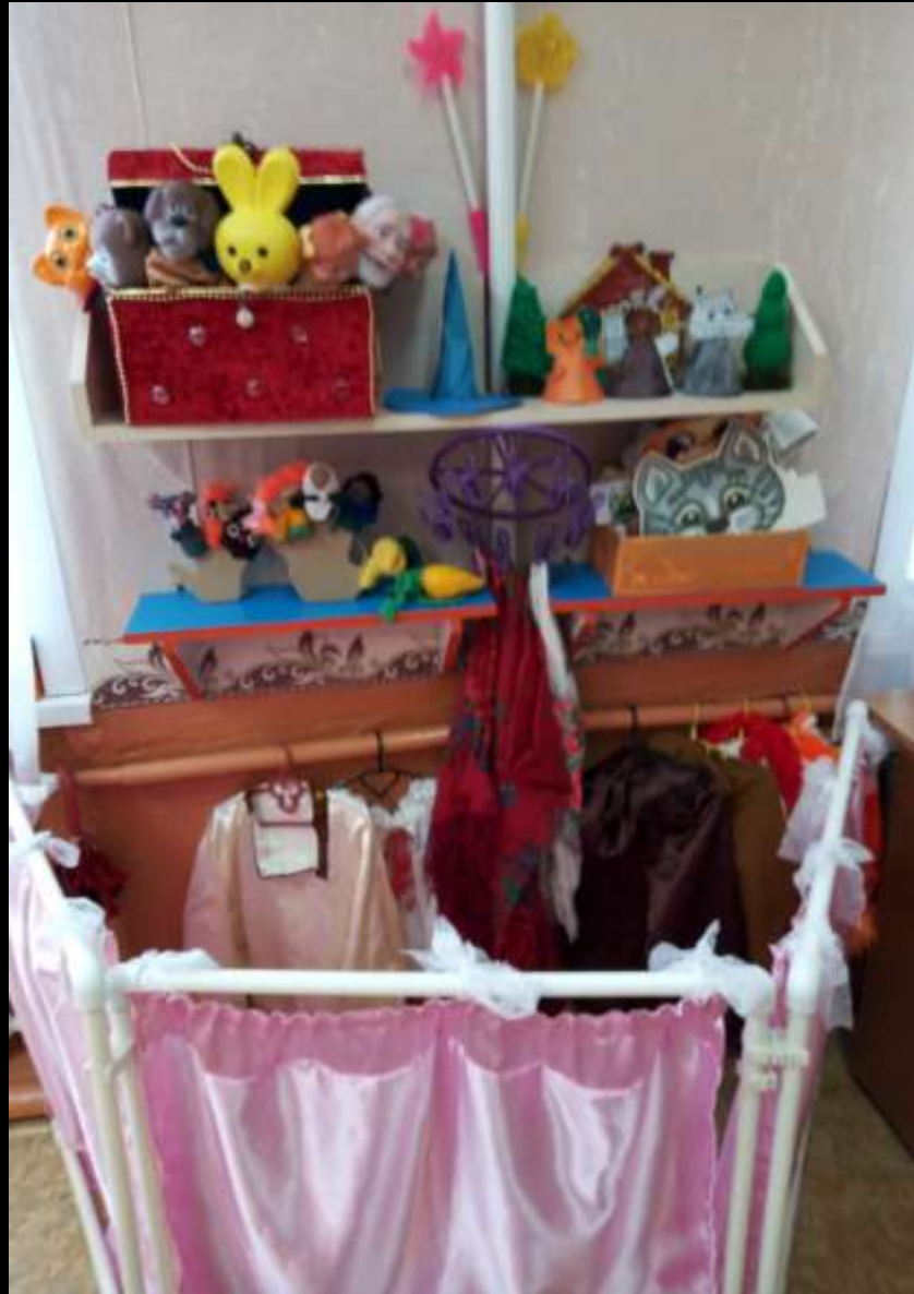
2.2.2. Активный сектор (уголок театра)