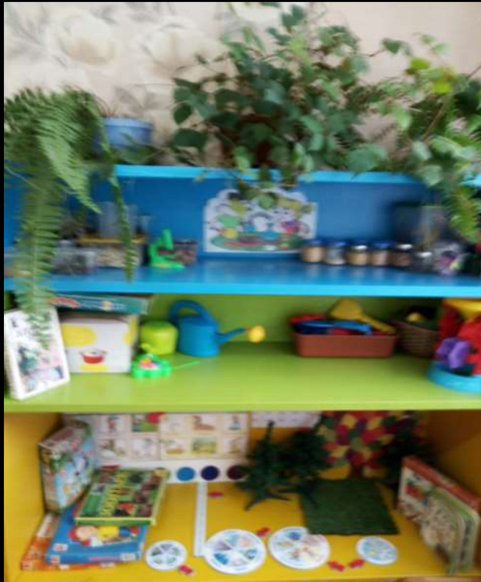
1.9. Рабочий сектор (центр живой и неживой природы)