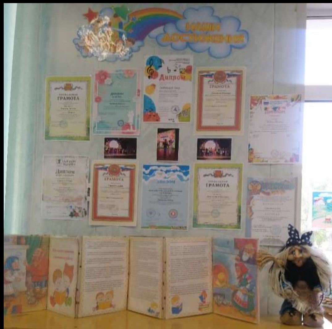
4.3. Среда для диалога с родителями (практический центр )