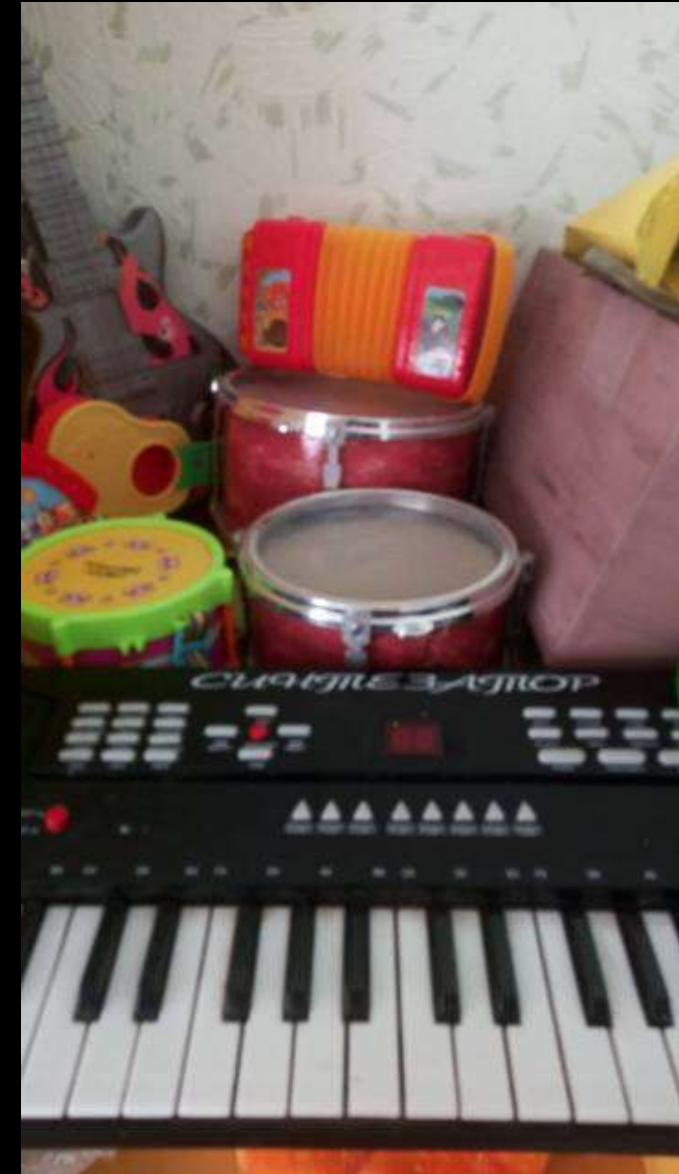
2.2.3. Активный сектор (уголок музыки)