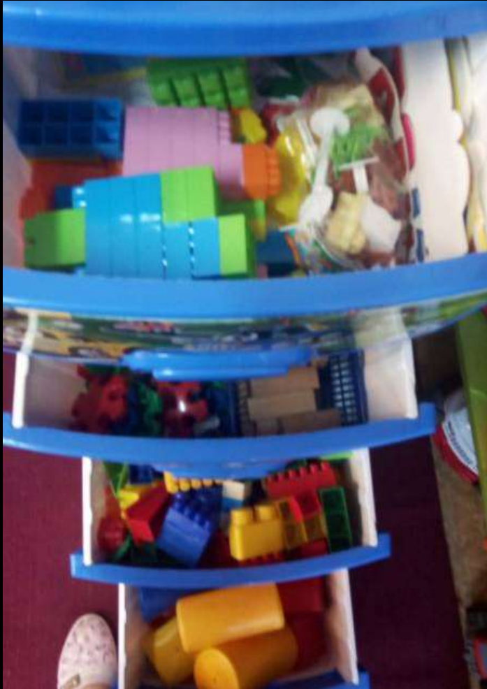
1.3. Рабочий сектор («конструирование»)