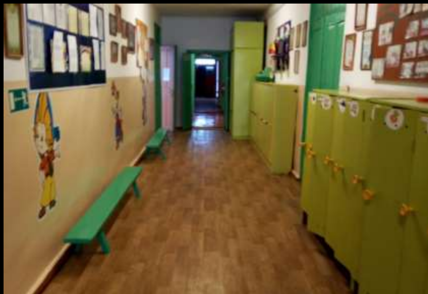
Вход в помещение, нижняя левая точка