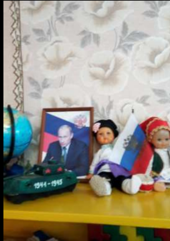
1.7 «Патриотическое воспитание» В модуле присутствуют куклы в национальных костюмах, имеется материал по декоративно-прикладному искусству России. Материалы центра пополняются работами детей: рисунки, тематическими альбомами «Моя семья», «Моя родословная», созданными совместно с родителями, фотографиями детей в альбом