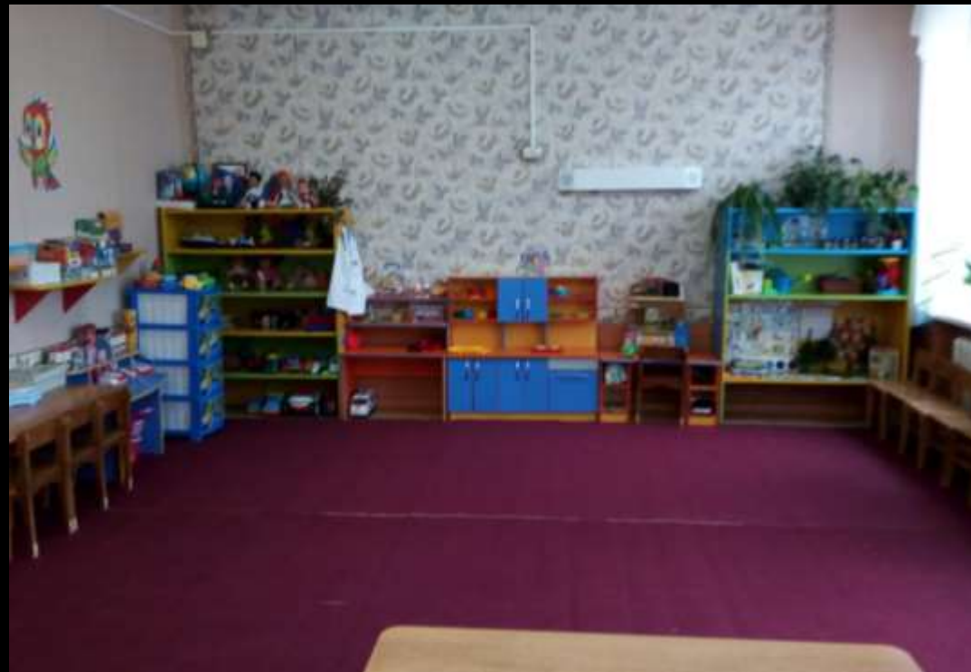
Вид из центра группы в противоположном входу направлении