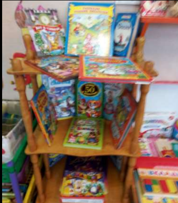
1.4 Рабочий сектор (уголок книги и развитие речи)