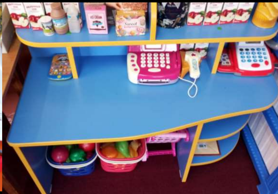
2.2.6 Активный сектор (уголок сюжетно-ролевые игры «Семья», «Магазин» )