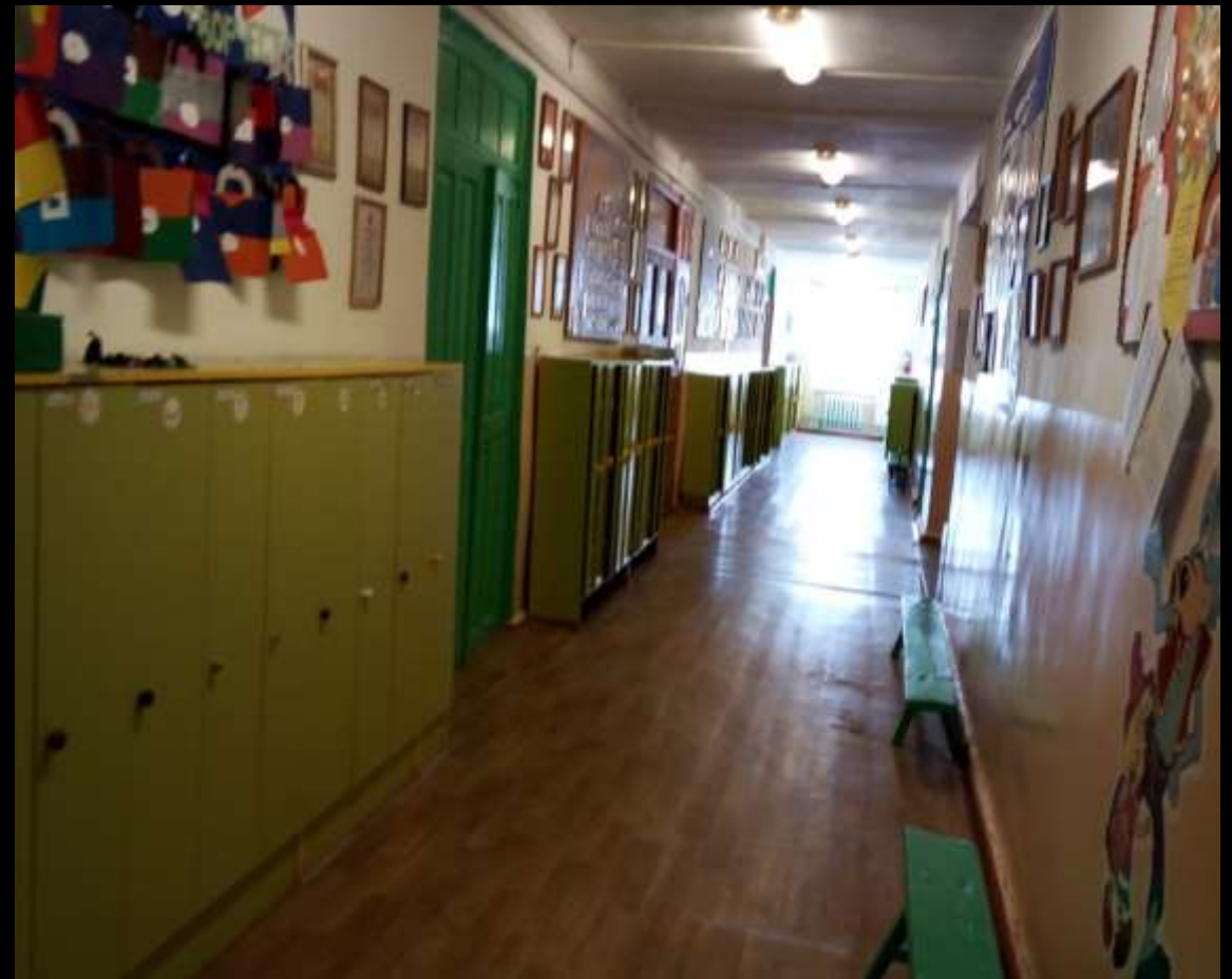
Вид из центра в противоположном входу направлении