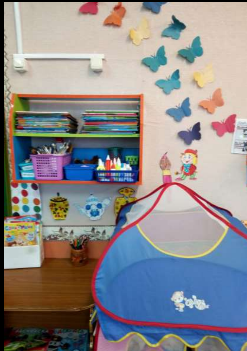
3.2. Спокойный сектор (уголок «Художественная мастерская»)