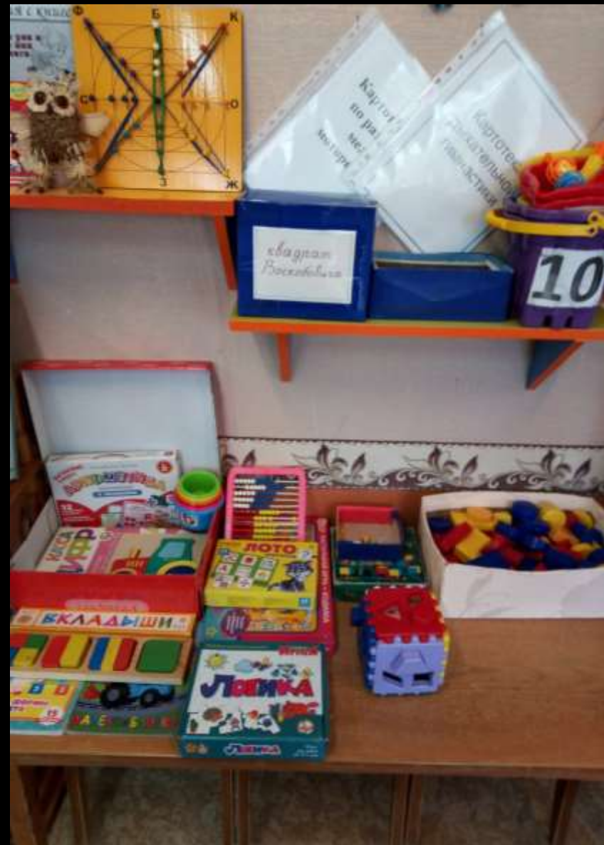
1.1.3. Рабочий сектор (уголок «Математика»)