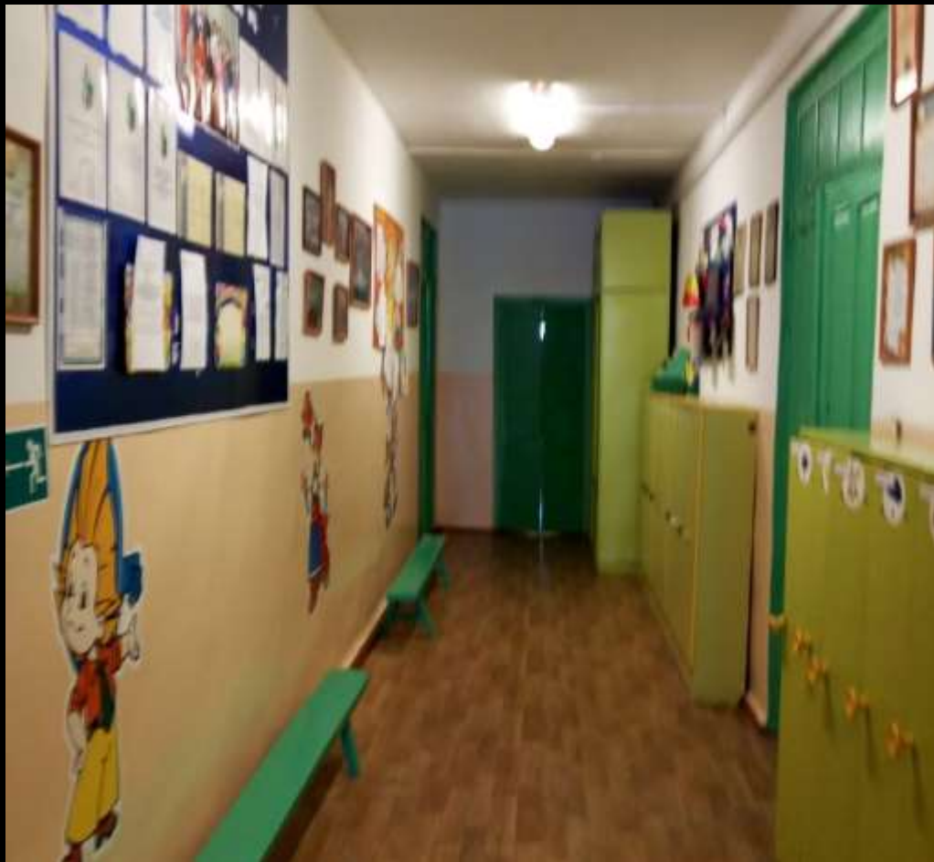
Вид из центра на вход в помещение