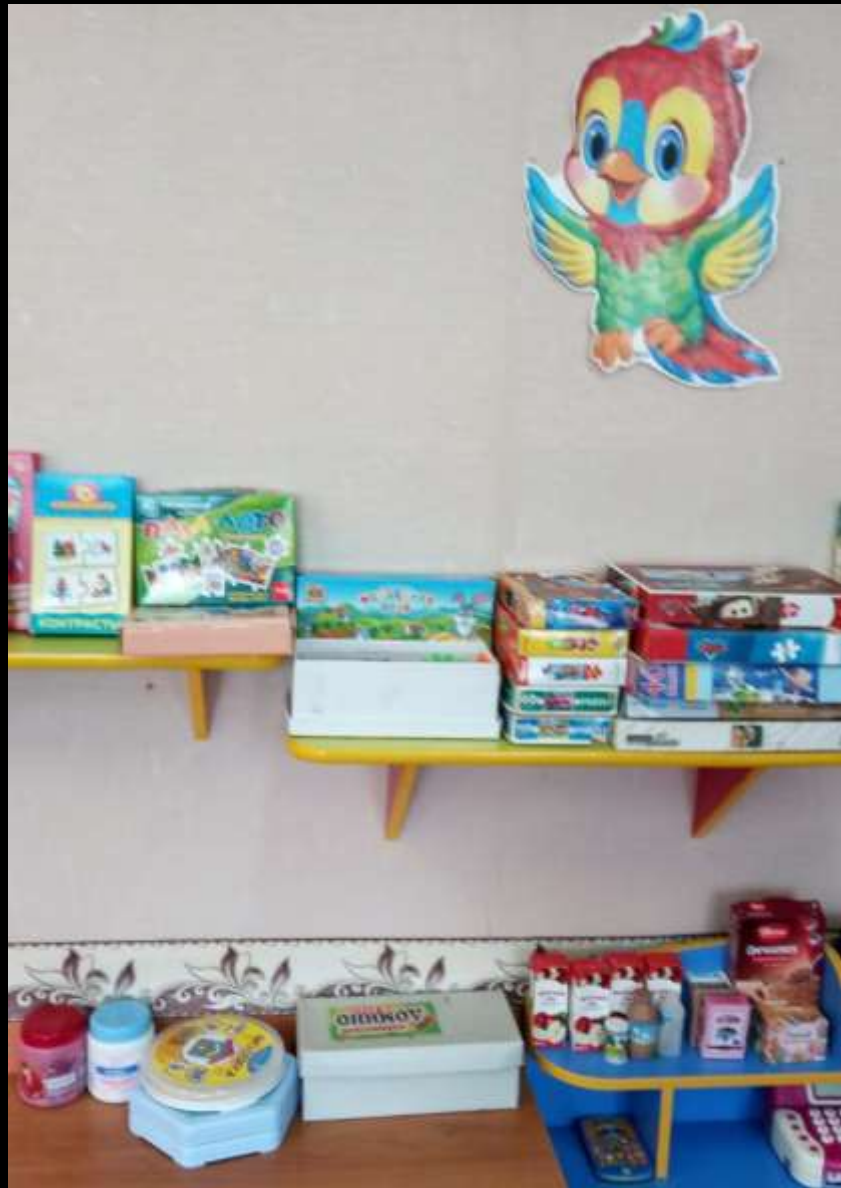
1.1.2. Рабочий сектор (уголок «Сенсорика - конструирование»)