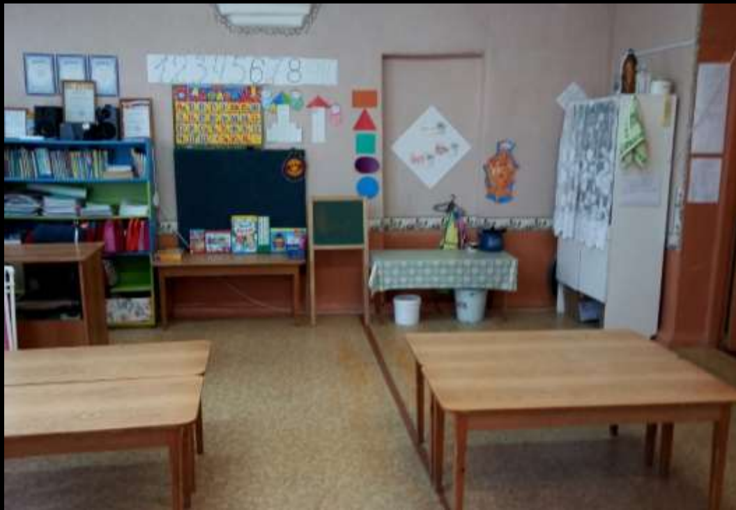
Вид из центра группы на вход в помещение